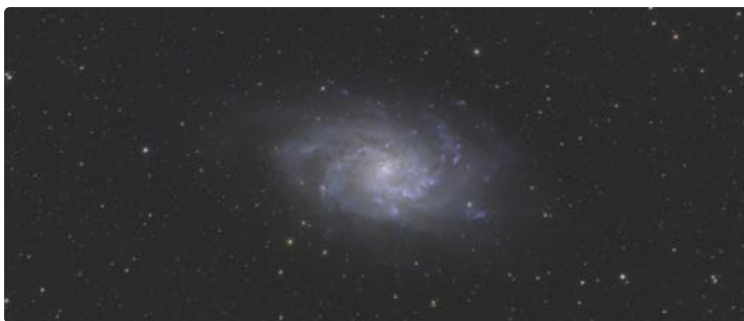
La galaxie triangulum prise des Damias