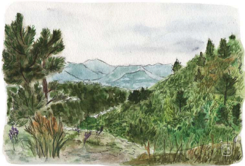
illustration : Clara Boullerne

Ça y est, l'aventure Chaumasse 2026 est lancée, et nous espérons la partager avec vous !