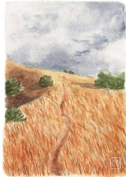
illustration : Clara Boullerne